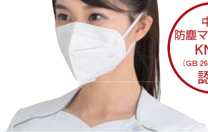
コンドルC 高感染対策マスクKN95 50枚入 品番 SD795-000X-MB 税抜価格(1箱) オープン価格