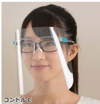
コンドルC 眼鏡型フェイスシールド フレーム・シールド 品番(フレーム) SD789-00LX-MB 品番(シールド) SD790-00LX-MB 税抜価格(1個・1枚) オープン価格