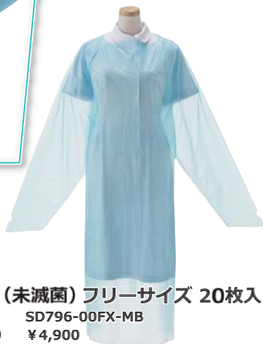
コンドルC ポリガウン(未滅菌)フリーサイズ 20枚入 品番 SD796-00FX-MB 税抜価格(1箱) ¥4,900