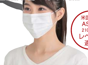
コンドルC 感染対策マスクE 50枚入 品番 SD794-00EX-MB 税抜価格(1箱) オープン価格