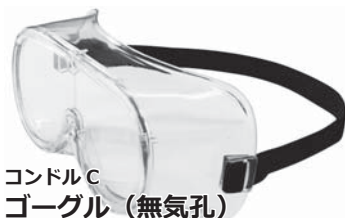
コンドルC ゴーグル(無気孔) 品番 SD829-000X-MB 税抜価格(1個) オープン価格