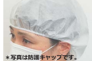
コンドルC 衛生キャップ(未滅菌) 100枚入 防護キャップ(未滅菌) 20枚入 品番(100枚入) SD825-000X-MB 品番(20枚入) SD826-000X-MB 税抜価格(1箱) オープン価格