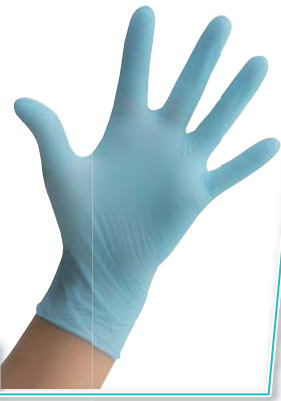
コンドルC ニトリル手袋パウダーフリー S/M/L 100枚入 品番(S) SD792-00SX-MB 品番(M) SD792-00MX-MB 品番(L) SD792-00LX-MB 税抜価格(1箱) オープン価格