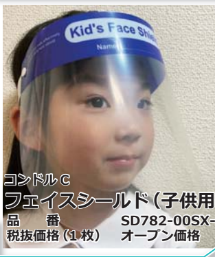
コンドルC フェイスシールド(子供用) 品番 SD782-00SX-MB 税抜価格(1枚) オープン価格