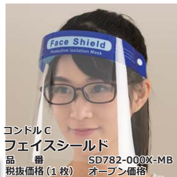
コンドルC フェイスシールド 品番 SD782-000X-MB 税抜価格(1枚) オープン価格