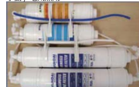
交換用フィルタセット 手動 / 電気兼用